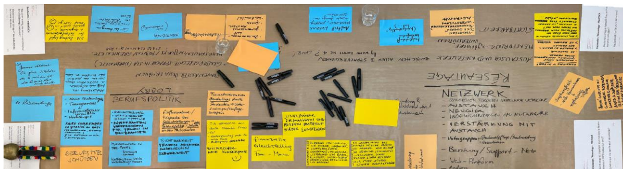
Fig. : Notes prises lors de l'atelier à l'assemblée générale du 23 juin 2023 à Zurich

Lors de l'assemblée générale de 2023, les membres et les invités présents ont discuté de ce qui devrait être pertinent dans le contenu des activités du réseau dans un avenir proche. Cela permet au comité du réseau et aux groupes régionaux de s'orienter sur la suite à donner.