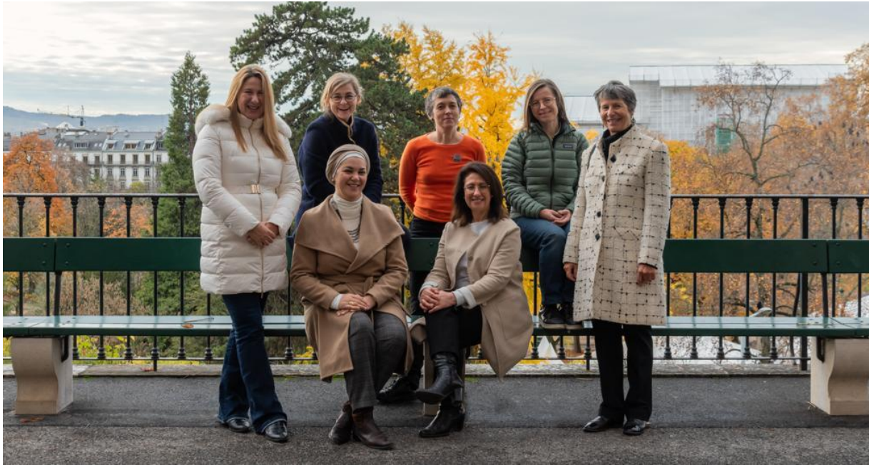
Fig. : Comité groupe régional de Genève