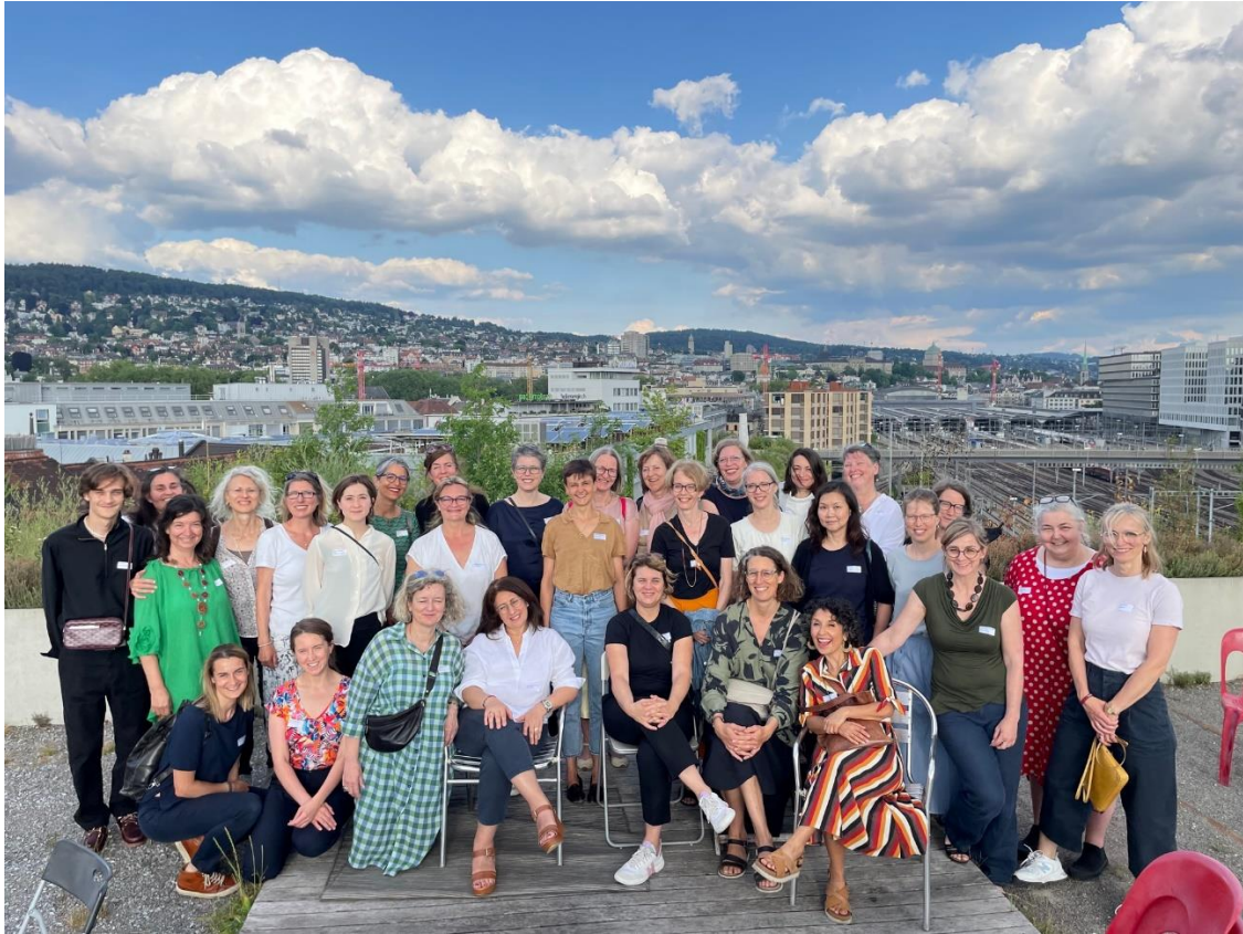
Visite guidée de la Zollhaus lors de l'assemblée générale 2023, Zurich