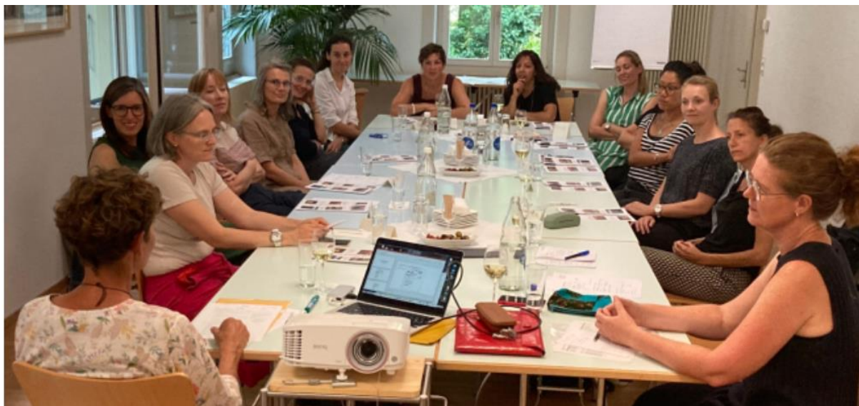
Fig. Manifestation « Compétence en matière de présentation - des impulsions pour plus de plaisir au travail »