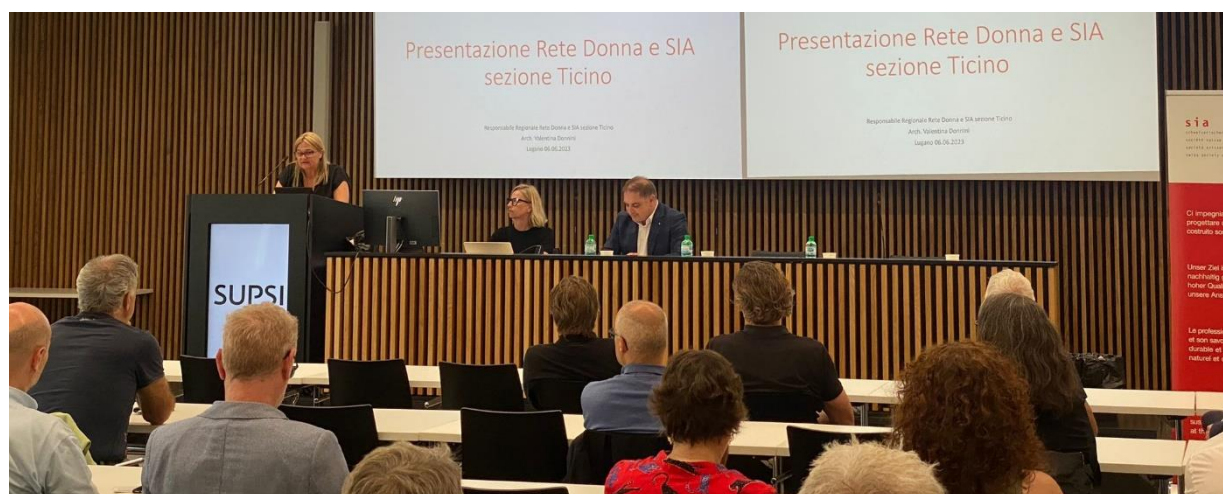
Fig. : Groupe régional Tessin auprès de la section

En juin 2023, nous avons été invitées à l'Assemblée Sia Ticino où le réseau a été exposé et présenté à toutes les personnes présentes, y compris les politiques. Il est prévu de renforcer la collaboration avec Sia Ticino, Otia, Cat et d'autres associations professionnelles. Présentation publiée sur les sites des catégories.