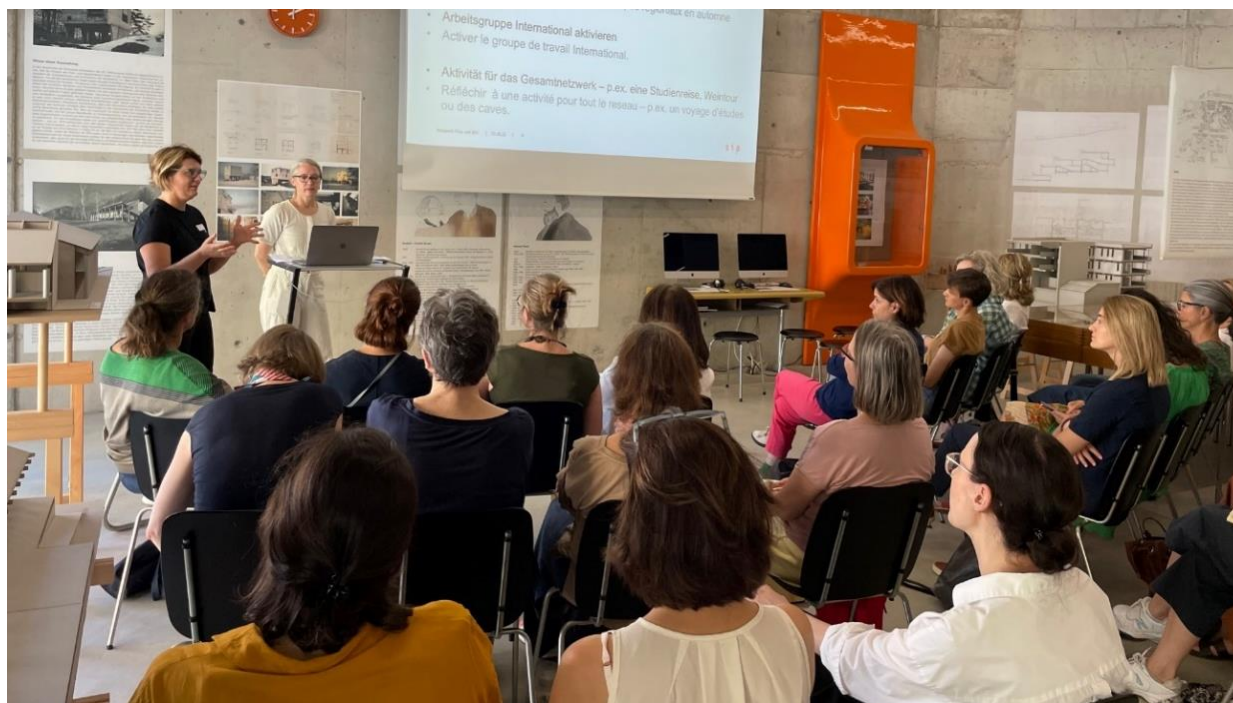
Fig. : À l'assemblée générale 2023, Forum de l'architecture Zurich