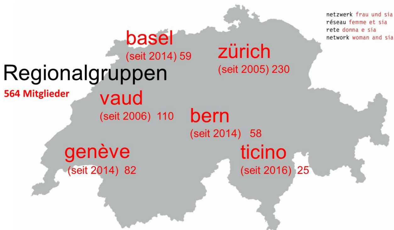
Fig. : Les groupes régionaux du réseau avec (année de création) et nombre de membres 12.2023