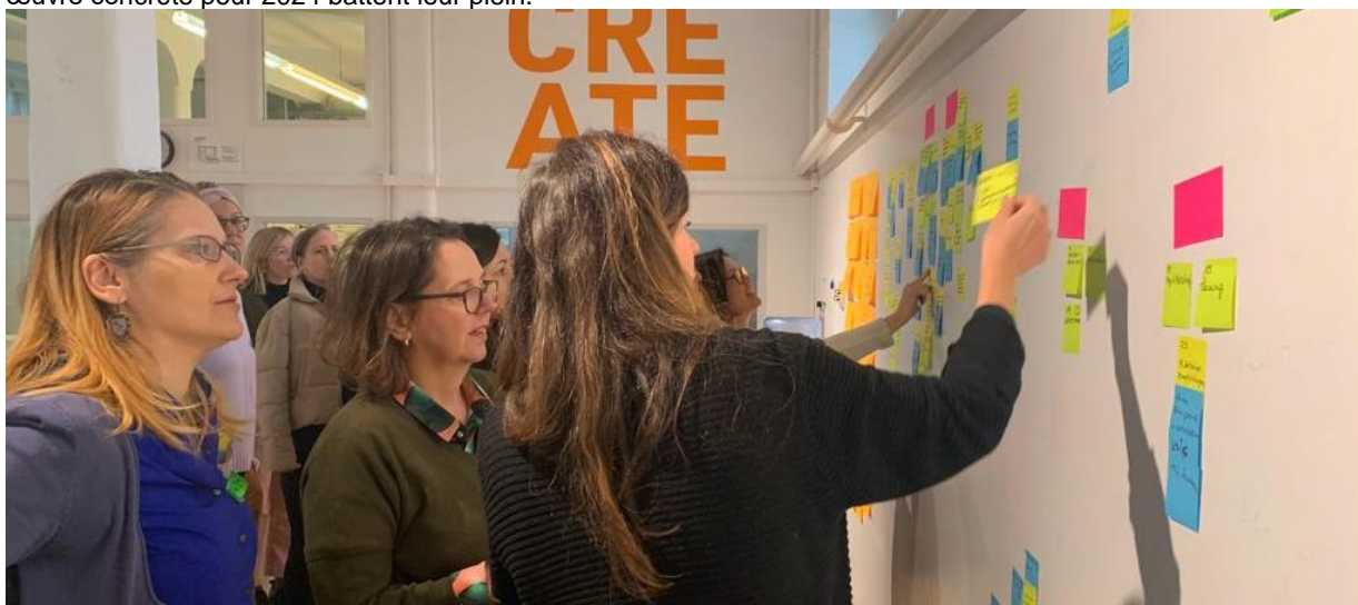
Fig. : Atelier du groupe régional de Bâle