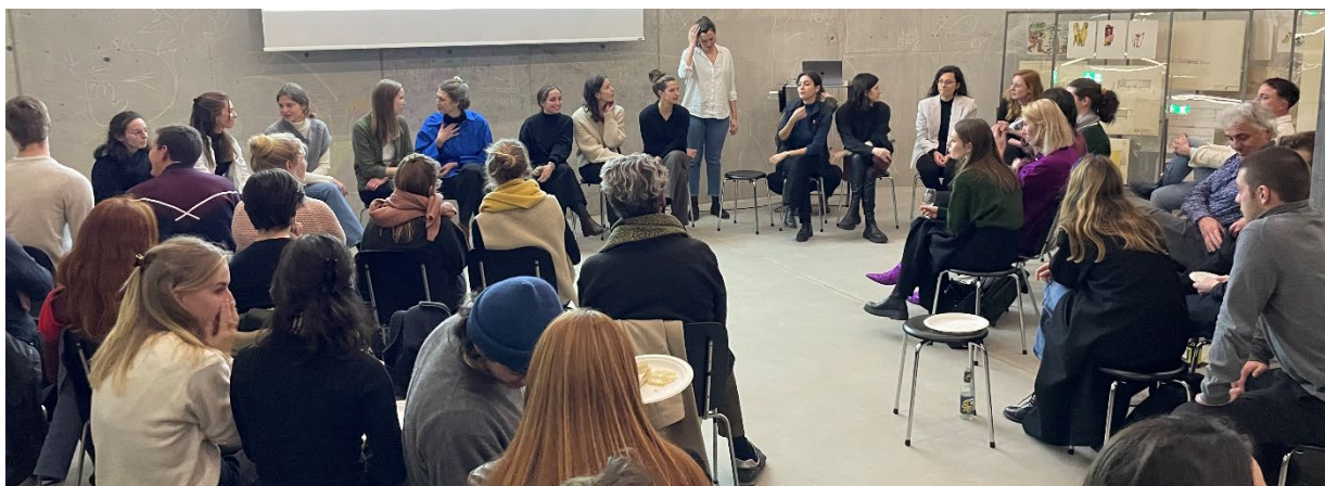
Anlass "SIA-Meisterin"

Am 1.12.2022 traf sich die Regionalgruppe zur Hauptversammlung im Architekturforum für eine offene Diskussion, live Musik und einem parallel dazu laufenden Fotoshooting für das Portraitprojekt 2023. Die professionelle Fotografin Mali Lazell konnte über einen Stiftungsbeitrag der Ernst Göhner Stiftung teilfinanziert werden. Etwa alle zwei Wochen werden im 2023 dann die Portraits unserer Mitglieder mit speziell dazu verfassten Begleittexten online publiziert werden.