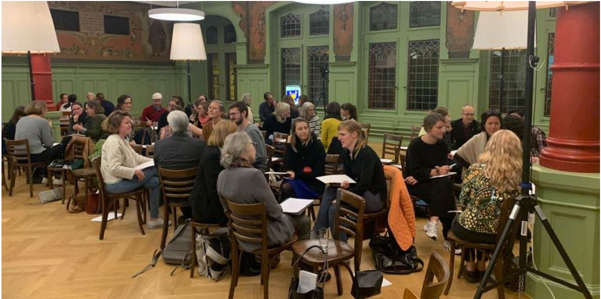
Dialogveranstaltung «Städtebau für eine fürsorgliche Gesellschaft», Basel