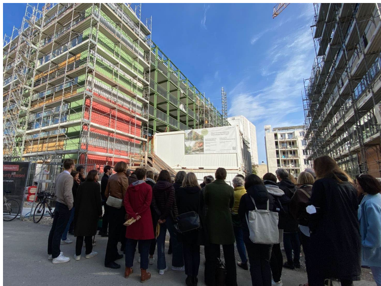
Baustellenführung Basel

Für die Entwicklung unserer Regionalgruppe ist im Januar 2023 ein Workshop geplant, in dessen Rahmen Ausrichtung, Formate, Partizipation und Potential unseres Netzwerks behandelt wird. Etablierte Formate wie Lunchtime-Treffen oder Führungen werden weitergeführt.