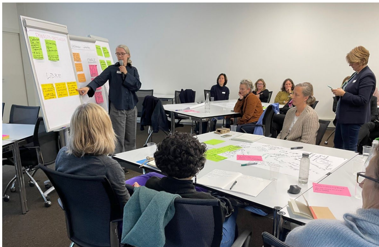
Abschluss des Workshops am 11.11.2022 in Genf.

Die Ergebnisse der Diskussionen stehen den Regionalgruppen und auf nationaler Ebene als Orientierung und Anregung für Aktivitäten im Jahr 2023 zur Verfügung. Der Vorstand wird die Ergebnisse in der ersten Sitzung 2023 aufgreifen und für die Aktivitäten der Ressorts diskutieren.