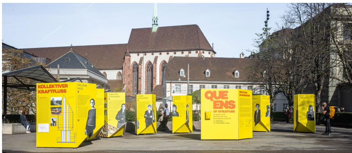
"Queens of Structure" Ausstellung Theaterplatz Basel

November 2022 – Das Netzwerk unterstützte die Verbreitung der Medienmitteilung des Schweizerischen Verbands freier Berufe SVFB Schweiz. Der Verband der freien Berufe fordert: « Mehr Frauen in den freien Berufen . Hindernisse für berufstätige Frauen müssen beseitigt werden». Paola di Romano nahm am 22.11.22 an der Präsidentinnenkonferenz von Alliance F im Bundeshaus teil. Das Netzwerk unterstützte die Ausstellung «Queens of Structure» , die in Basel vom 20.10. bis 27.11.2022 auf dem Theaterplatz frei zugänglich war ( https://queens-of-structure.org/ ). Für den Ausstellungskatalog haben Alexa Bodammer und Paola di Romano das Vorwort zur Schweizer Ausgabe verfasst. Margarethe Müller aus dem nationalen Vorstand des Netzwerkes sprach ein Grusswort an der Vernissage. Alexa Bodammer moderierte ein Generationengespräch zwischen drei engagierten wie erfolgreichen Bauingenieurinnen: Valentina Kumpusch, Vizedirektorin ASTRA und Chefin Abteilung Strasseninfrastruktur West, Jana Müller, Studentin Bauingenieurswesen im 3.Semester an der FHNW sowie Charlotte Bofinger von Zirkular und Mitglied des Kollektivs «Rethink Materials».